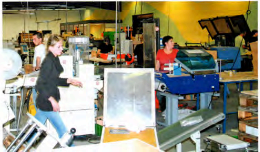
Les TPE seront à l'honneur à l'occasion d'un colloque à l'ICN à Nancy organisé par le Club TPE le 19 février prochain.

«La Conquête est un état d'esprit, une manière de penser positivement, d'aller de l'avant, sans pour autant nier les difficultés du quotidien, mais en cherchant des signes positifs, en s'appuyant sur les talents de tous pour réinventer un modèle